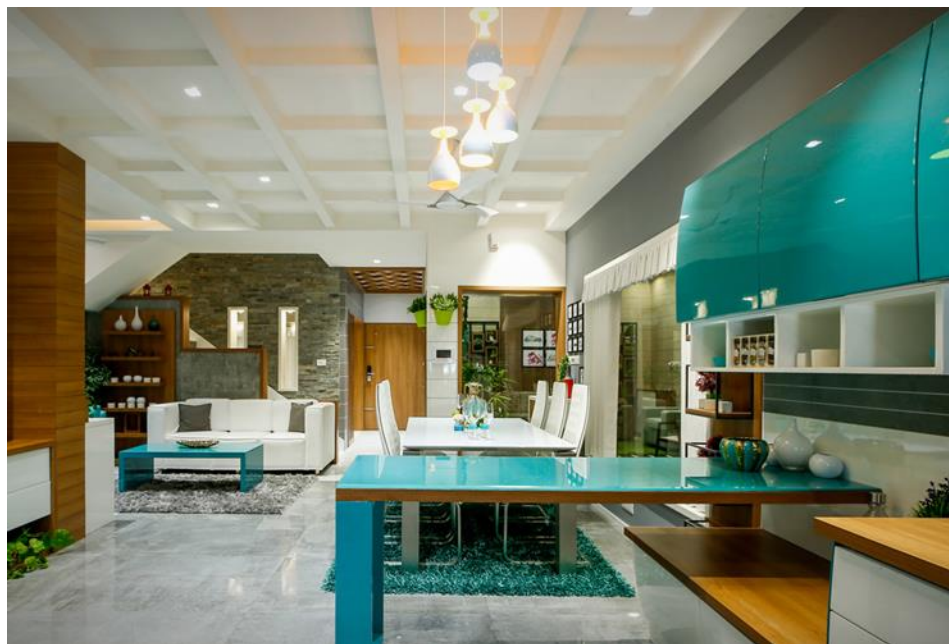
Fig.1.6. Concepția design-ului interior OSS-brand pentru aplicațiile „Office-Total”.