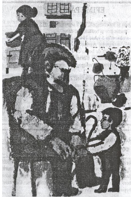
Ministrul bunelului de Spiridon Vanghell. Desen de Isaiă Cîrnu

În cei peste 20 ani de independență, ar fi fost posibil de transformat această țară într-o bijuterie a Europei. A fost și este posibil în continuare. Este nevro doar de îndeplinit o singură condiție - dorința cel din Executiv și Legislație să asigure și să dirijeze dezvoltarea Republicii Moldova în același spațiu, în aceeași direcție cu statele de voltate ale lumii. Trebuie să avem mai multă încredere și fermitate în ceea ce realizăm, și să eliminăm sindromul inferiorității din noi. Este nevoie de puțină critică și mai puțin nihilism, dar de mai multă sugestii și idei rezonabile, întru asigurarea unui ritm continuu de dezvoltare a țării alături de celelalte state ale lumii. Oare statele Asiei Orientale nu pot servi exemplul pentru Republica Moldova?